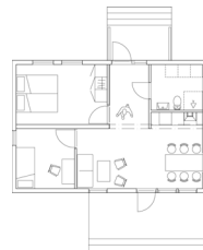
alt 2 - 54 m 2 , 2-4 ppl